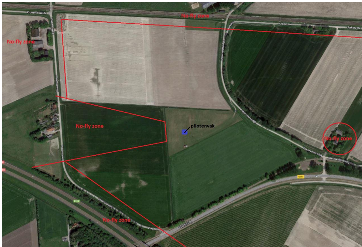
Figuur 1 Waar mogen we vliegen en waar niet

A58- Vliegtuigen, helikopters en drones mogen niet achter de lijnen vliegen aangemerkt met No-fly zone op figuur 1 gezien vanuit het pilotenvak.